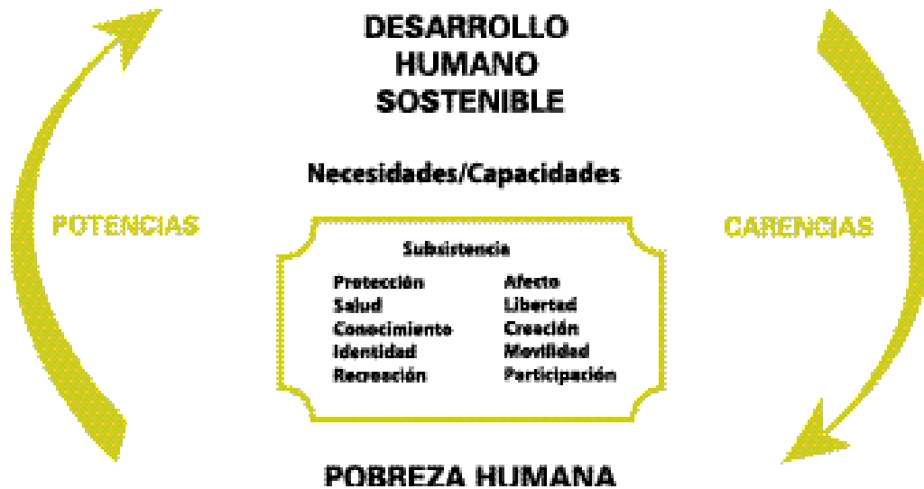
Diagrama 1.1. Esquema conceptual del Desarrollo Humano Sostenible.

Fuente: Tomado de Amelia Márquez de Pérez . "Conferencia La Pobreza en Panamá"(2001).